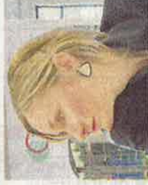
Veldig godt møte med frivillige org om strategien mot vold og seksuelle overgrep mot barn. Kunnskap, kompetanse og samarbeid går igjen.