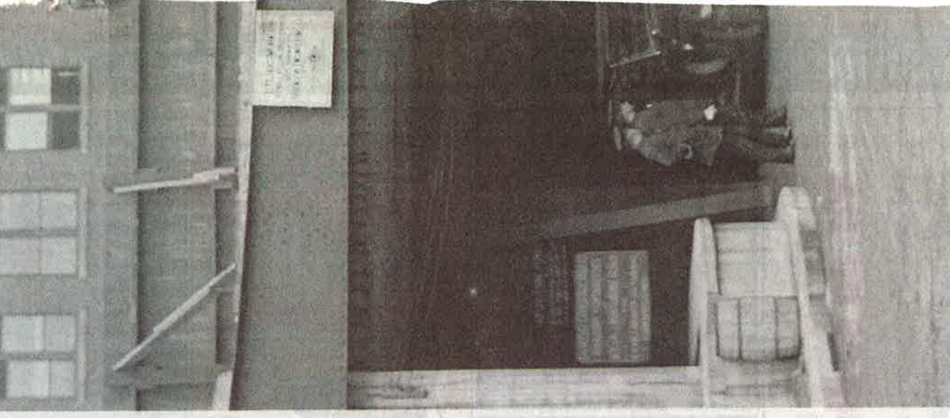
FØRSTE BIL UT: Her kommer den første bilen